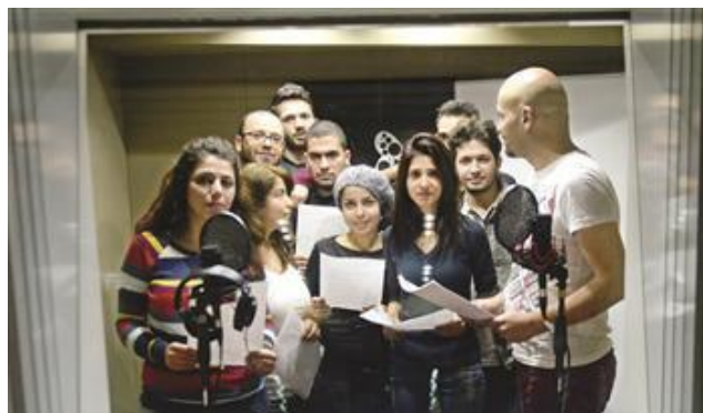
(HD紙インターネット版より)

また、トルコ全体で50校以上のシリア人学校がある。イスタンブールではそのほとんどが、エセンユルト、エセンレル、ウムラニエ、パシヤクシェヒルなどの郊外に位置している。エセンユルトのシリア人学校は自治体とシリアのKadimun教育財団が設立し、1年生から11年生までのクラスがあり、619名の学生が現在通学している。(11月15日付HD紙1面、インターネット版)