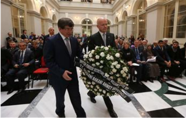
(HD 紙インターネット版より)

在イスタンブール英国総領事らが犠牲となった 2003 年の同時多発テロから 10 年を迎え、20 日、英国総領事館で追悼式典が行われた。式典には英国外相、トルコ外相、在トルコ英国大使等が出席した。(11 月 21 日付 HD 紙 5 面)